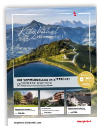
Bsp. Sommer 2020

*Reisebuchung erfolgt mit „ab Preis“ für 2 Erwachsene bzw. 2 Erwachsene + 1 Kind