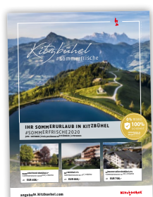
Bsp. Sommer 2020

Die Bewerbung* der Angebotsgruppen erfolgt mittels „ ab Preisen “ für die Angebotsgruppen 3, 4 & 7 Nächte einheitlich für 2 Erwachsene bzw. bei Angebotsgruppe Family 2 Erwachsene + 1 Kind .